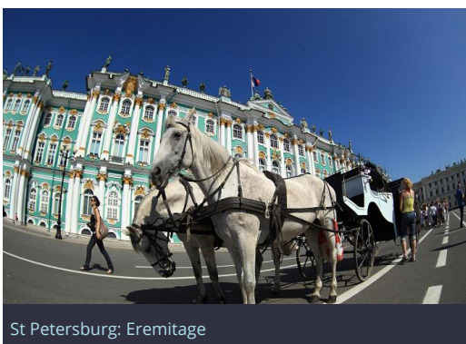
St Petersburg: Eremitage